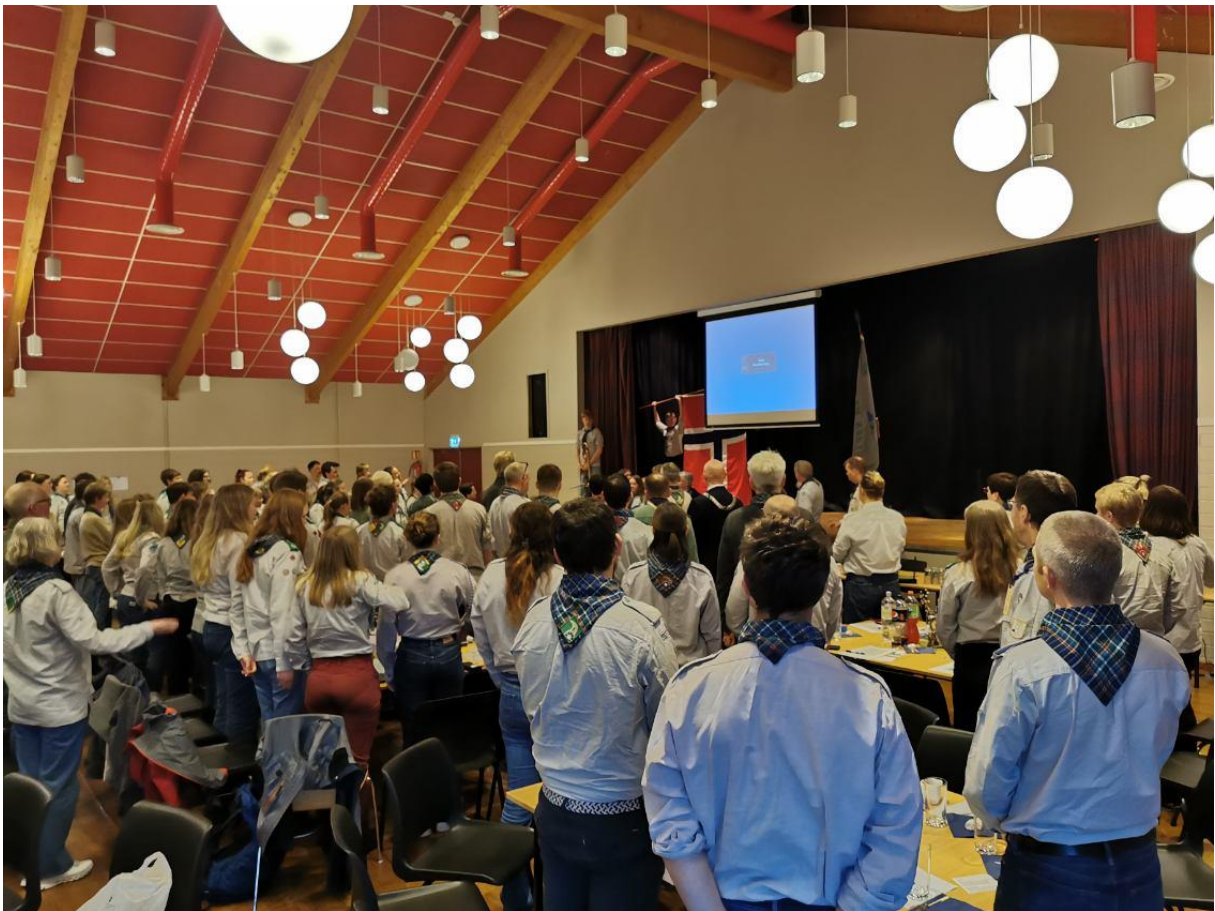
Kretsting Vesterlen med 132 delegater, nesten halvparten under 25 år