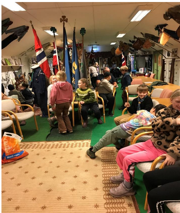
Besøk av 22 småspeidere og 5 ledere fra 1. Sandnes