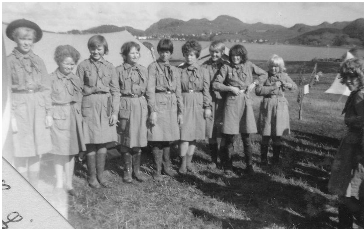
Fra kretsleir på Ålgård i 1964.