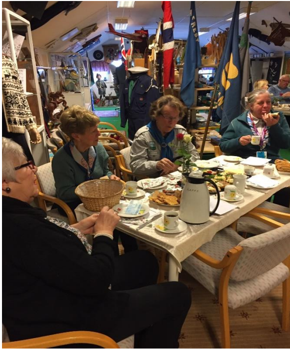
Gjett om det smaker?