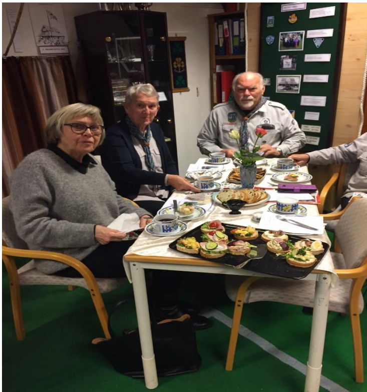
Flere som koser seg