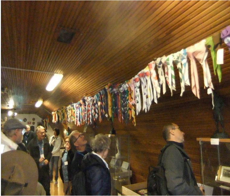
Speidermuseet på Island