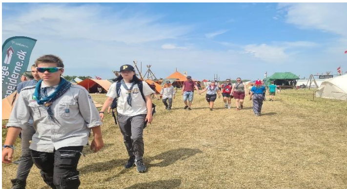
På vei til aktivitet

Etter en hel uke på leir, ble leiren pakket ned lørdag 30. Juli, for tidlig avreise søndagsmorgen, det ble en lang reise hjem med slitne speidere.