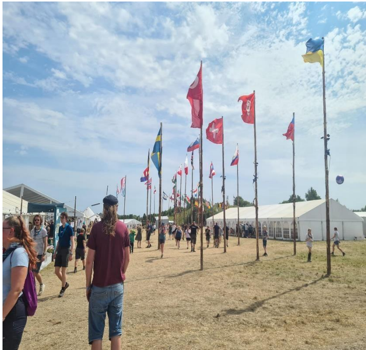
Alle nasjonenes flagg vaier i vinden

Nesten ved midnatt 23.juli, etter mer enn 15 timer på tur, ankom vi endelig Spejdernes Lejr 2022. Stående buffet, og rett i teltene som heldigvis var blitt satt opp av et par lederer og rovere som ankom noe tidligere på dagen med bil, henger og fellesutstyr.