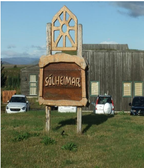
Senteret vi var på