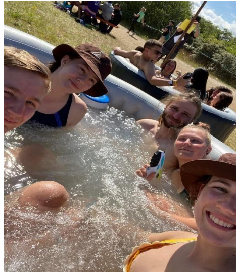
Herlig i jazzusien