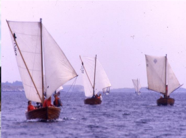
Regatta med speiderslupper

Speiderforbundet hadde fått konstruert en egen båt for sjøspeidere, en Speiderslupp. Speiderforbundet hadde fått bygget en båt til seg, og troppene på Østlandet hadde fått bygget flere slike båter.