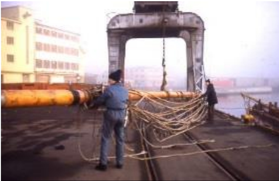
Kaikran ble brukt til å sette opp mastene

Økonomien var dårlig, så for å spare penger til slipping på vårparten ble Nordsjø tatt inn på grunt vann ved flo sjø, og speiderne gjorde rent der de kom til ved fjære sjø, til dels ble det sen kveld/natt.