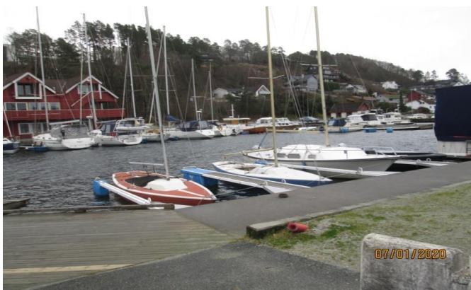
Slik ser havnen ut i dag.