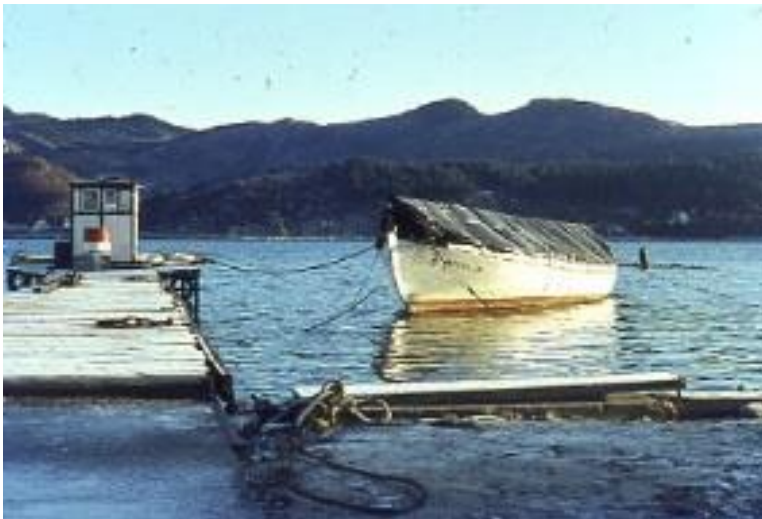
Vinteropplag på Lura der skøyta ble dekket til for vinteren.

Etter leiren ble forbundets slupp fraktet til Sandnes for å prøve om den var aktuell. Vi fant den lite egnet til bruk i vårt farvann, og seilte den videre til Karmøy slik at sjøspeiderne i Vedavåg kunne låne den.