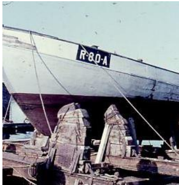
Skøyta på slipp for å sette på kjøll

Som losskøyte hadde det vært jernkjøl under midtpartiet av båten, men den ble fjernet i den tid båten var fiskeskøyte.