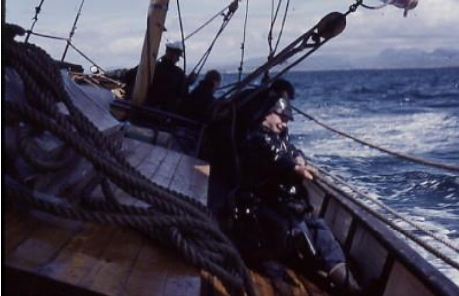
Frisk seilas, skjøtene strammes

Etter mønster fra en svensk sjøspeiderbåt fikk Gunnar tips om arbeidsfordeling om bord.