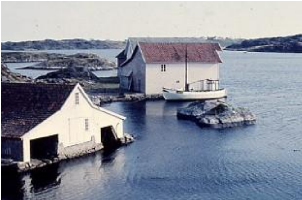
MS «Sigrid» i Vedavåg