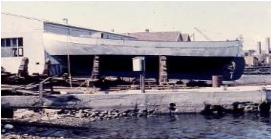
Kjølen på plass og Nordsjø klar for sjøsetting