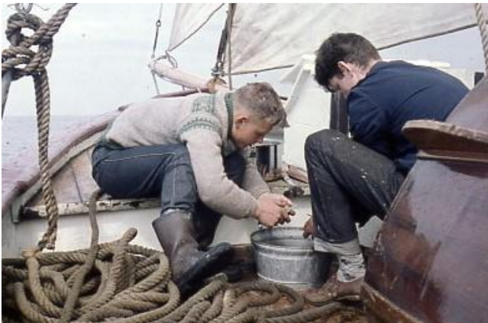
Mat må det til, her potetskrelling.

Det ble brukt primus til matlaging. Byssa lå forut der den hadde vært som fiskeskøyte.