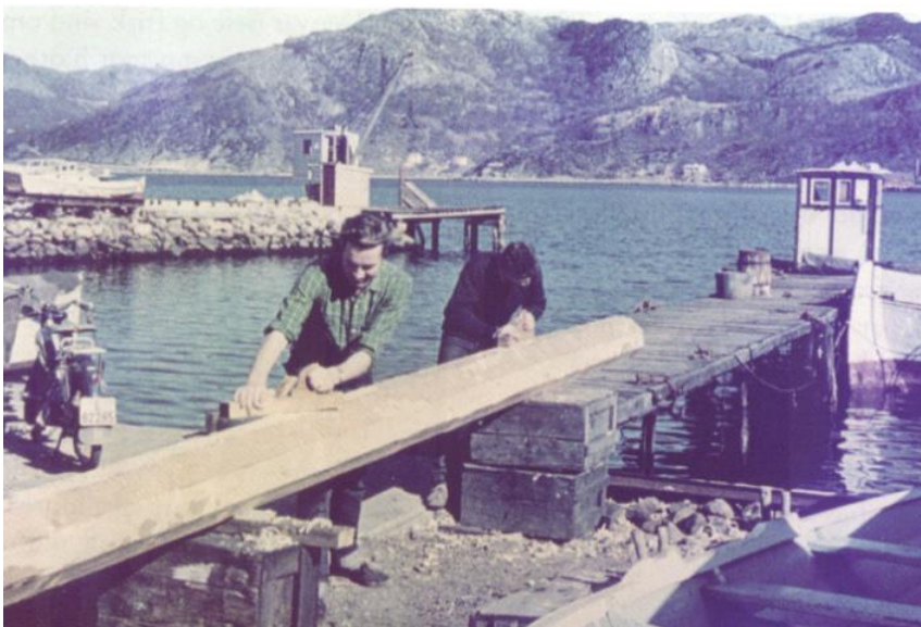
Høvling av ny stormast for å lage den rund

Da den var fiskeskøyte rommet lasterommet 200 hl, sild. Dette ble innredet til salong med plass til 12 køyer.