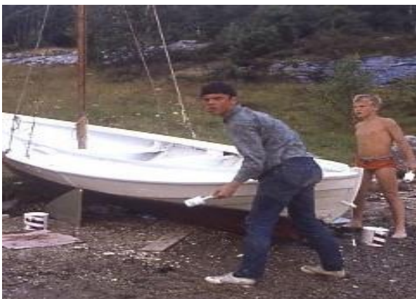
Oppussing av færingen

Det første som ellers ble kjøpt var en færing med seil og årer.