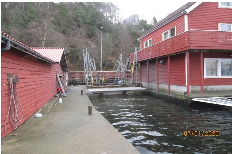
Slipp og kaier

For tiden arbeider elever fra tømmerlinjen ved Gand videregående skole på huset, og de vil om et par uker ha lukket det, slik at de kan begynne på innredningen. Elever fra elektro skal ta installasjonsarbeidet. Samtidig foregår dugnad, og nå er det i havnen det er mest aktivitet. Det blir bra kai ved bygget og også slipp. Nybygget blir i to etasjer med loft. I første etasje blir det en 60 kvm stor båthall. Huset har en grunnflate på snaut 200 kvm.