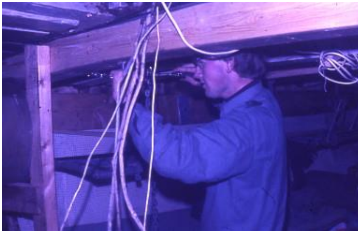
Alt arbeid innvendig ble gjort på dugnad, og båten ble så vidt klar til påsketokt i 1971.

Det var trangt i køyene, så i 1970 det ble det bestemt å heve dekket. I Vatlandsvåg ble dekket skåret løs, og jekket opp 40 cm, og spantene forlenget i løpet av vinteren.