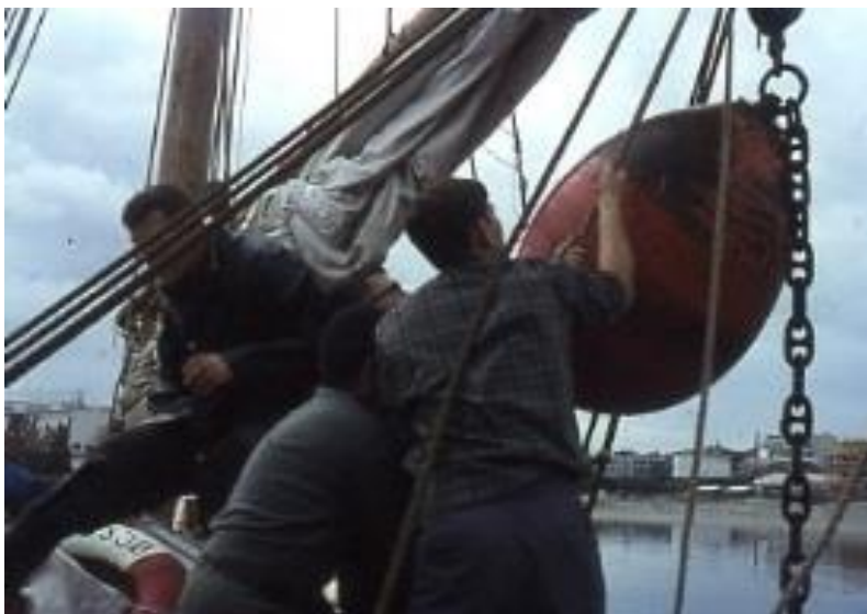
«Nordsjø» ble brukt til å legge ut bøye

Det ble trangt i havnen på Lura da det ble skaffet flere båter. Etter avtale med Havnevesenet flyttet speiderne inn til Vågen i Sandnes i 1966.