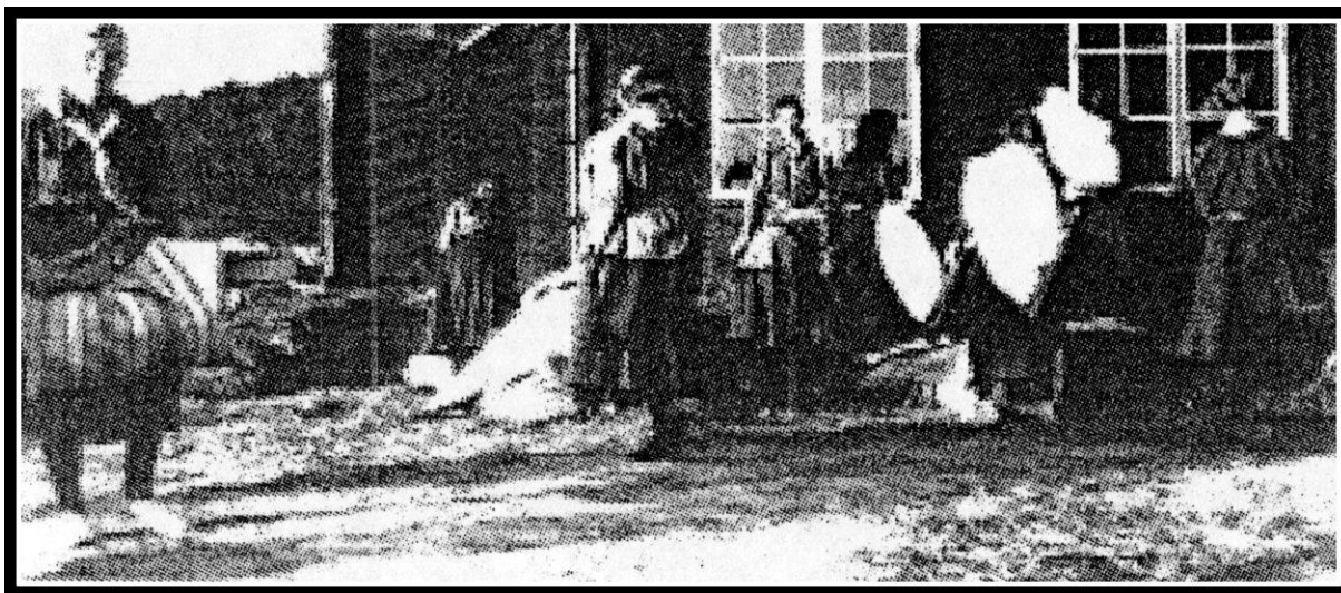
Madrassene fylles med høy

Hele 50 danske KFUK-speidere kom fra København De vakte atskillig oppmerksomhet og beundring ved sin freidige sang og kjekke opptreden, skriver Margrethe Parm i et referat fra leiren. Ellers forteller hun: «Det hele var som et eventyr! Tur over fjellet i strålende sol, sjøturen fra Bergen med «Vindafjord», liten plass og lite søvn og herlig morgenkaffe ved Haugesund. Fest i Stavanger og fest gjennom hele leiren. Ca 250 speidere og 1 WC- inntil vi lærte å innrette oss! Det var sol og regn, lyng og revebjeller og sauebjeller. Det siste glemmer vi ikke, men festlig var det tross alt slit».