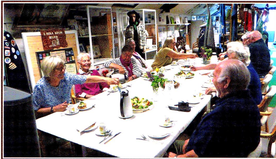
VI AVSLUTTER VÅRSESONGEN 2021