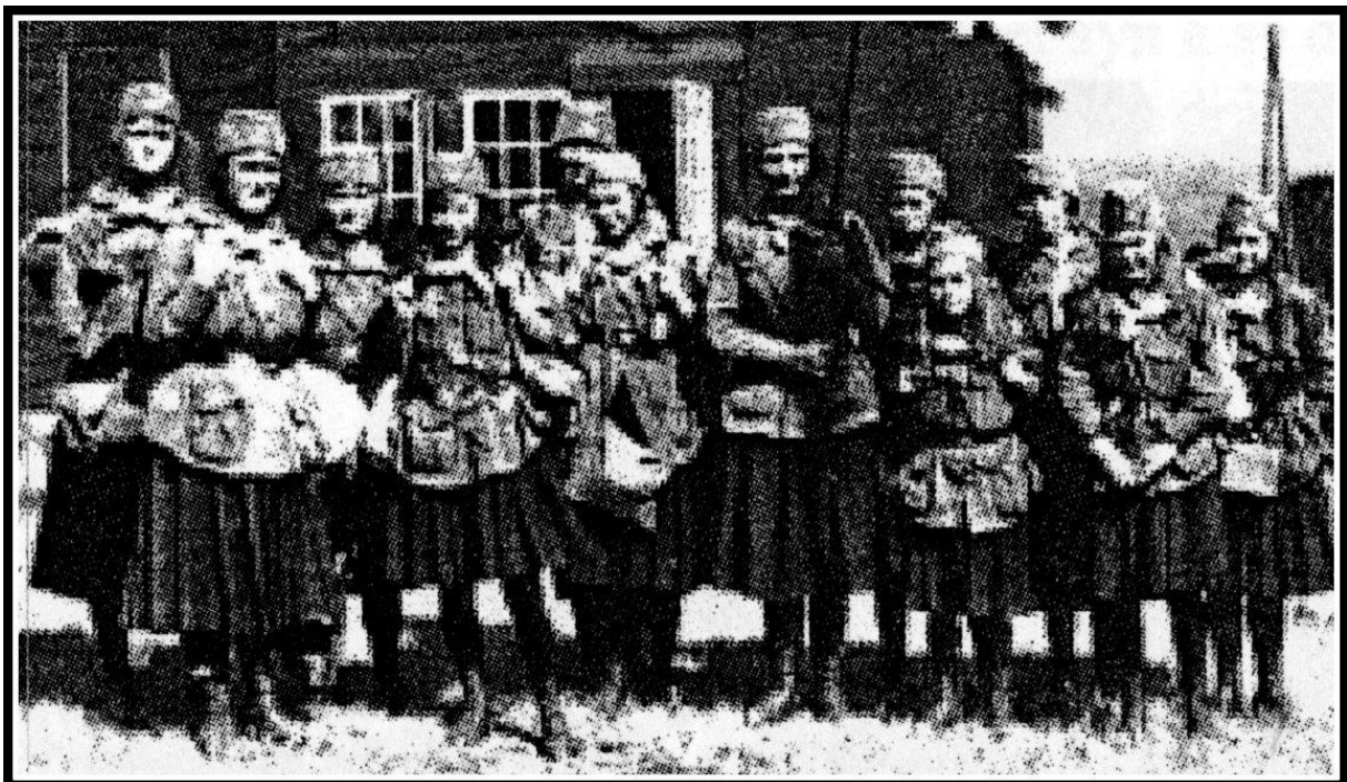
Sandnes-troppen på Sand