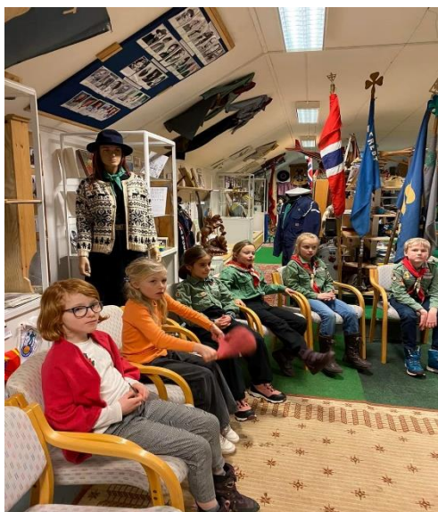
Besøk av speidere (3. klasse) fra Varden speidergruppe.