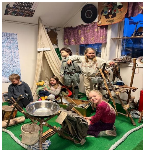
Torsdag 16.mars hadde museet besøk av 9 småspeidere og 3 ledere fra 25.Stavanger K/M. De fikk øvd seg på morse og svarte på mange speiderspørsmål. Veldig koselig besøk. Åse